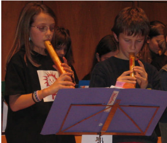
Kinder bei der Präsentation ihres Instruments am Bambusflötentag 2006

Das verstärkte Engagement wurde belohnt durch gestiegene Schülerzahlen in diesem Fach.