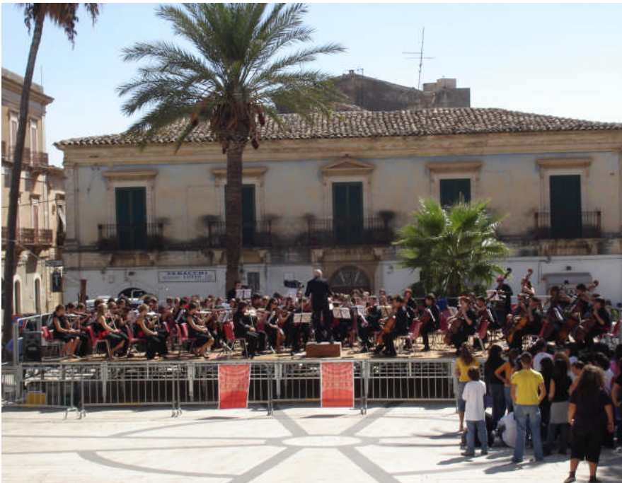
Impression von der Konzerttournee 2006 des Jugend Sinfonie Orchesters Konservatorium Bern durch Sizilien.

Das Jugend Sinfonie Orchester (JSO) ging im Oktober 2006 auf eine Tournee nach Sizilien. Unter dem nun bleibenden Motto: Bridges for the Future haben wir Gäste aus 7 Nationen in das Orchester integriert. Der Erfolg war wiederum gross und im Anschluss konnte das JSO das hohe Niveau in einem Arena Konzert im Kursaal vor nahezu vollem Haus eindrücklich darbieten.