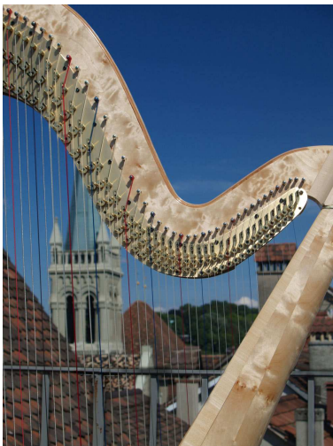
Neue Konzertharfe