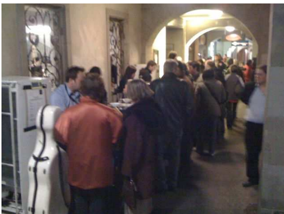
Barbetrieb an der Museumsnacht

Das Jugend Sinfonie Orchester konnte wiederum mit einem massgeblichen Beitrag von unserem Verein unterstützt werden. Der übliche Beitrag konnte gegenüber den Vorjahren ausnahmsweise um 50% erhöht werden. Das JSO führte im vergangenen Frühjahr eine Reise nach Israel und ins palästinensische Ramallah durch - eine musikalische Bildungsreise, welche bei den jungen Musikerinnen und Musiker ein