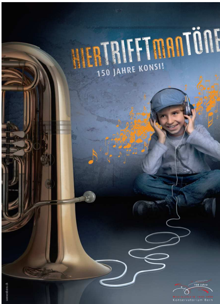
Jubiläumspakat (Gestaltung Sonnen Bern)

aber vor allem auch mit den unterstützenden Stiftungen, Sponsoren und Spendern. Ein ganz besonderer Dank geht an die Werbeagentur Sonnen in Bern, welche unentgeltlich für das Jubiläum arbeitete. Die extrem publikumswirksame und unserer Devise „Lust auf Musik“ folgende Visualisierung und Gestaltung verlieh dem ganzen Jubiläum einen besonderen Glanz.