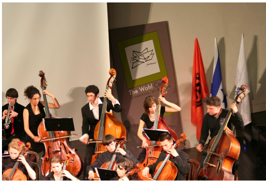
Konzert JSO in Tel Aviv gemeinsam mit israelischen Musizierenden

das Patronat des Projektes zu übernehmen.“